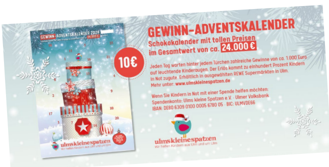
Plakat Florian Zimmer © Florian Zimmer / Gewinn-Adventskalender © ulmskleinespatzen / Geschenke @ Diakonie

Der Verein unterstützt regionale Projekte und bestehende Initiativen, die nachhaltig dort helfen, wo Unterstützung dringend benötigt wird. Ulmskleinespatzen zeigen Situationen von Kindern in Armut auf, machen auf deren Lebenslage aufmerksam und bieten ihnen sinnvolle Hilfestellungen an. Das Ziel ist es Kindern unserer Stadt den Weg in ein selbstbestimmtes und verantwortungsbewusstes Leben zu ermöglichen. Projektbeispiele sind zum Beispiel „Hilfe für Trennungskinder“ oder aber die „Jugendfarm in Ulm“. Jeder kann einen wichtigen Beitrag leisten, um die Not von Kindern in unserer Region zu lindern. Bei Interesse informiert sie der Verein gerne näher. Sie können aber auch gerne anrufen und einen Termin vereinbaren zum Kennenlerngespräch: 0731 360 803 39 oder senden Sie eine E-Mail an: info@ulmskleinespatzen.de