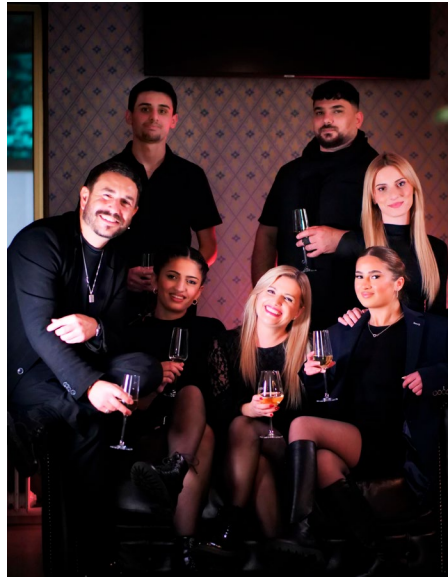
Su Misura Artisan Hairwork

Das Team von Su Misura Artisan Hairwork freut sich auf euren Besuch und darauf, auch weiterhin euer Styling-Partner zu sein. Su Misura, Brückenstraße 1, 89231 Neu-Ulm Tel.: 0731 79089066, www.su-misura.de